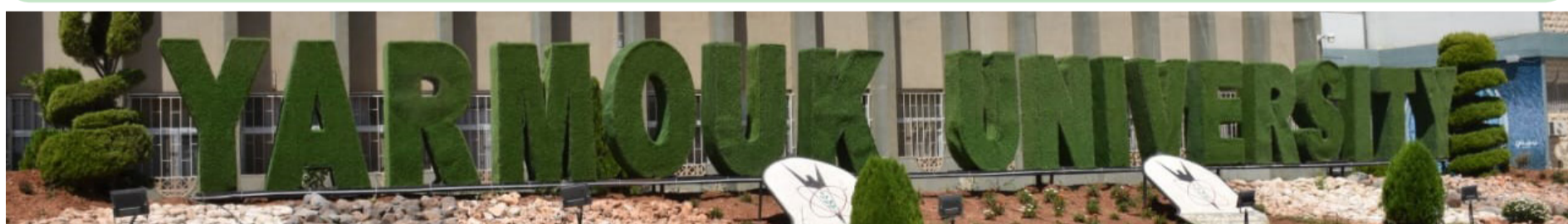
طلبة اليرموك الأعزاء

ترحب بكم عمادة شؤون الطلبة في جامعة اليرموك أجمل ترحيب، وتدعوكم للمشاركة بكتاباتكم المتنوعة في مجالات الشعر، القصة القصيرة، المقال، الخاطرة، والرسومات الكاريكاتورية وغيرها من فنون الكتابة والرسم، قي جريدتكم، جريدة " طلبة اليرموك " التي تصدرها العمادة بشكل دوري. يمكنكم إرسال مشاركاتكم إلى قسم النشاط الثقافي والإعلامي في العمادة عبر الإيميل التالي: